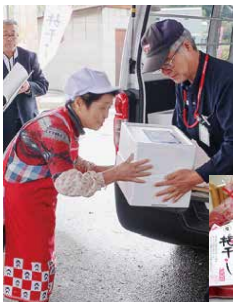
ゆうパック発送式