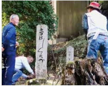
音はしくれか（山頭火の句碑）

農事組合長協議会は10月13日から15日の3日間、京都・石川・富山で視察・研修をしました。JA加賀の農産物直売所で現在の3億円の売上げに至るまでの経緯について説明を受けました。